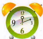
звук часового механизма